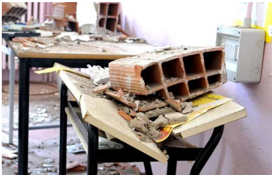
Scuole Lodi Crevalcore Maggio 2012